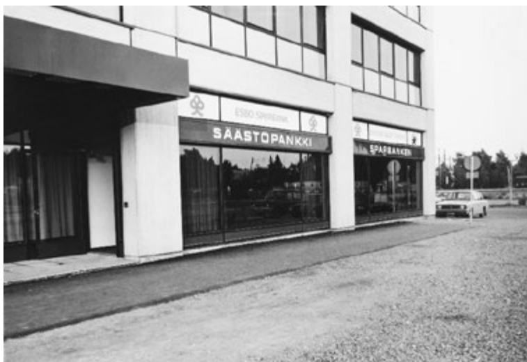
▲ År 1975 flyttade Esbo Sparbank in i det nya och moderna ämbetshuset i Esbo centrum. Huset revs år 2013.