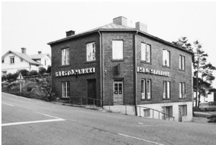
▲ Esbo Sparbanks första filialkontor öppnades år 1970 i bageriföretaget Bröder Halmes affärshus i Köklax.